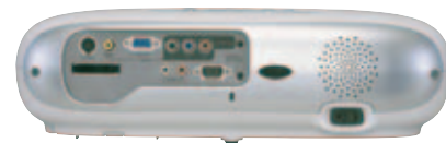
Immagine delle interfacce di EPSON EMP-TW10H