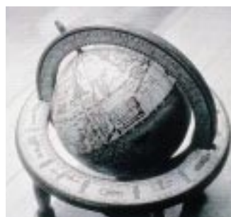
Senza EPSON MicroGray 1200

Da sempre attenta ad interpretare le versatili esigenze del mercato EPSON ha realizzato EPL-5700L, stampante laser compatta e dalle alte prestazioni, ideale per le necessità di stampa personale, sia a casa che in ufficio. La qualità di stampa è eccellente, con risoluzione di 600 dpi equivalenti a 1200 dpi con tecnologia EPSON MicroGray 1200. Anche la velocità, pari ad otto pagine al minuto in formato A4, è interessante, così come l'estrema semplicità d'uso, le ridotte dimensioni e l'ampia compatibilità con sistemi Windows e Mac di ultima generazione tramite l'interfaccia USB standard.