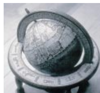
Con EPSON MicroGray 1200