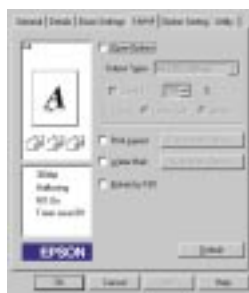
Driver di stampa