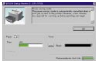
EPSON Status Monitor 3

I driver di EPL-5700L supportano inoltre funzioni di stampa davvero interessanti per chi deve produrre relazioni, report e comunicazioni aziendali efficaci. Con "Filigrana" è possibile, ad esempio, personalizzare una pagina con scritte o marchi in semitrasparenza; "Zoom" consente di ingrandire o ridurre un documento dal 50% al 200%; la funzione "Layout di stampa" permette di riunire due o quattro pagine in un foglio. Davvero comodo poi EPSON Status Monitor 3, funzione del driver che fornisce informazioni sullo stato della stampante, oltre che sulla quantità di toner e carta disponibili.