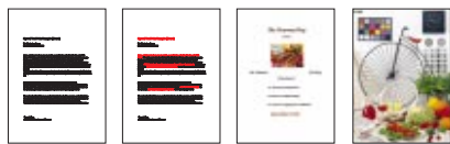
1 - A4, Text memo, modalità Economy, nero 2 - A4, Text memo, modalità Economy, colore 3 - Documenti in A4 con testo e foto, Modalità Normal 4 - Foto A4/A3 Modalità Fine