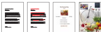
*1 - A4, Text memo, modalità Economy, nero *2 - A4, Text memo, modalità Economy, colore *3 - Documenti in A4 con testo e foto, Modalità Normal *4 - Foto A4/10x15 cm Modalità Photo