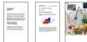
A4, E-Memo, nero* 1 A4, testo e grafici, colore* 2 A4 Foto* 3

EPSON Stylus C70 è dotata delle interfacce standard USB «plug-and-play» e parallela. Per la connessione in rete è disponibile come opzione un server di stampa esterno.